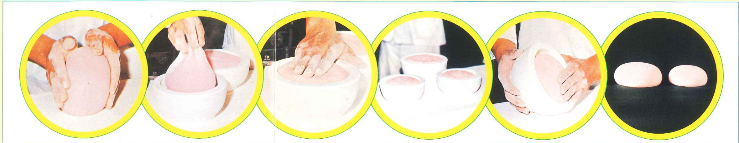
型を整えます 型に入れます 底を手で軽く押えます 2～3分でOK 返転するだけで…… 時間はしめて5分

搗き上げた餅を取粉を散布した板上にのせ、幾分さながら適当な大きさに切り、形を整えます。 型に入りやすいように粉を付けながらまるめ写真のように入れて下さい。 型に入れた餅は、軽く手で押えて平らにして下さい。 餅の大きさによって放置時間は変わりますが、普通2～3分で写真のように型をとります。 取粉の散布した板上に石膏型を反転して置いたうえ、持ち上げれば容易に脱型出来ます。 誰にでも簡単に短時間で形の整ったお鏡餅が出来ます。