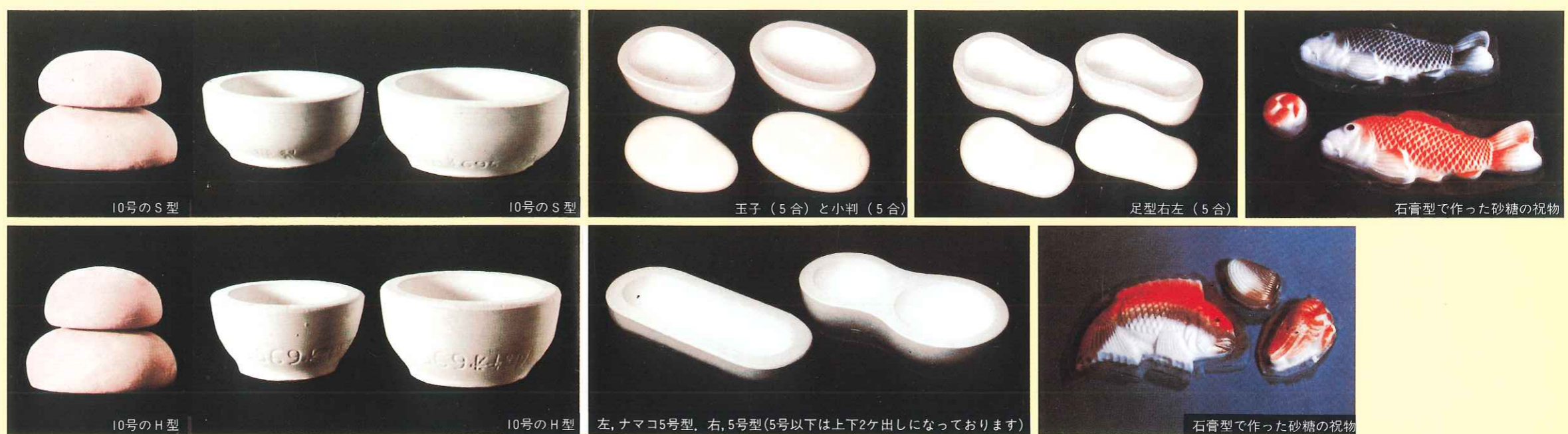
10号のS型 10号のS型 玉子(5合)と小判(5合) 足型右左(5合) 石膏型で作った砂糖の祝物 10号のH型 10号のH型 左、ナマコ5号型、右、5号型(5号以下は上下2ヶ出しになっております) 石膏型で作った砂糖の祝物