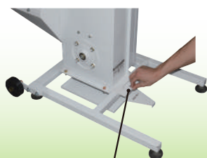
残留米排出シャッター