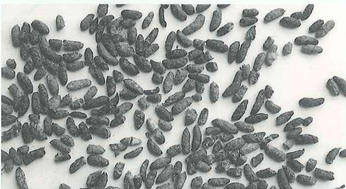
○玄米には1トン当たり1~10個ものネズミの糞が混入されています。